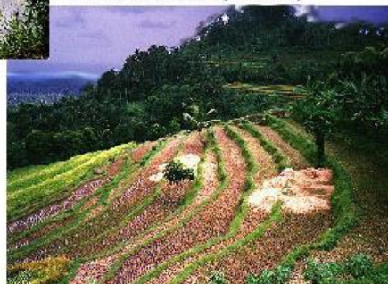
cultures en terrasses (Indonésie)